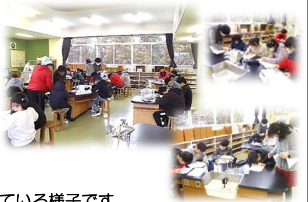
3年生以上が、理科室で頑張っている様子です。